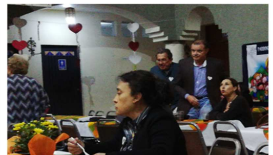
Con la participación de todos y su presencia fue un evento inolvidable.