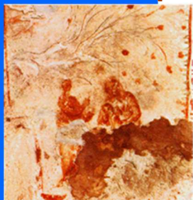
Imagen de la sta Anunciación en la Catacumba de Sta. Priscilla, se considera la más antigua, principios siglo III.

La Solemnidad de la Anunciación a María es también, e indisolublemente, la fiesta de la Encarnación del Verbo de Dios.