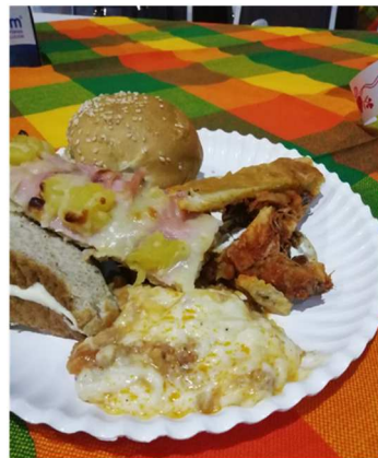
Una rica y variada cena compuesta de múltiples viandas, pasteles y el sabroso clericot, fueron un deleite.

Y más fotos que por falta de espacio no aparecen, mil disculpas