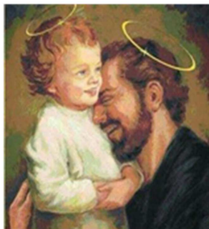
Señor san José y el Niño Jesús